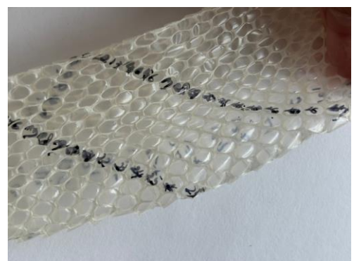
②体鱗列数のウロコの数