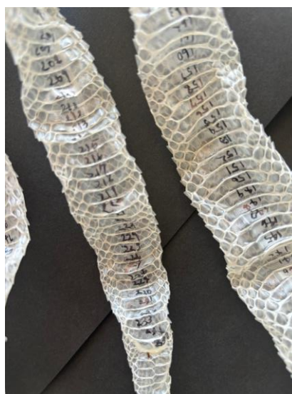
①腹板のウロコの数